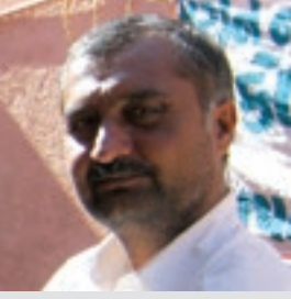
ઈડીસી પ્રમુખ, પરોડીયા

આજથી બે વર્ષ પહેલા અમારા ગામમાં લોકો કુવા-ડંકી તેમજ ખેતરેથી પીવાનું તેમજ વપરાશનું પાણી મેળવતા હતા. મરીન નેશનલ પાર્ક, જામનગર દ્વારા આઈ.સી.ઝેડ.એમ. પ્રોજેક્ટ અંતર્ગત આજે ગામમાં પાણીના ટાંકા / સ્ટેન્ડ પોસ્ટ અને તળાવ રીનોવેશનની કામગીરી દ્વારા આજે ગામમાં ફળીયાવાર પાણી મળતું થયું છે. જેના દ્વારા લોકોને પીવાના તથા વપરાશના પાણીની મુશ્કેલી દુર થઈ છે. જે ઈકો ડેવલોપમેન્ટ કમિટિની સક્રિય ભાગીદારી અને મરીન નેશનલ પાર્ક, જામનગરના અધિકારીશ્રીઓ અને સ્ટાફને આભારી છે.