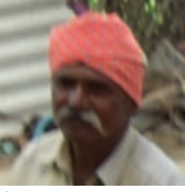
ઈડીસી પ્રમુખ, નાના આમલા

નાના આમલા ગામમાં મુખ્યત્વે મુસ્લિમ જાતિનાં લોકો વસવાટ કરે છે. જેનો મુખ્ય વ્યવસાય માછીમારી અને ખેતી છે. ગામમાં આજે ઈકો ડેવલોપમેન્ટ કમિટિ દ્વારા માછીમાર માટે રસ્તો અને ખારા પાણીનાં પ્રવાહની તીવ્રતા ઓછી કરવા સંરક્ષણ દિવાલના કામો થકી આજે માછીમાર ભાઈઓને રોજગારી અને માછીમારી ઉત્પાદન વ્યવસ્થા સરળ બની છે. જેથી ગ્રામજનો વતી હું મરીન નેશનલ પાર્કનો આભાર માનું છું.