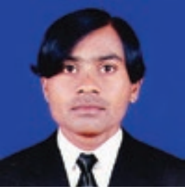
ઈડીસી પ્રમુખ, ઢીચડા

ઈકો ડેવલોપમેન્ટ કમિટિનાં ઉત્સાહી યુવાન પ્રમુખશ્રી કહે છે કે, “સંકલિત દરિયાકાંઠા વિસ્તાર વ્યવસ્થાપન” કાર્યક્રમ દ્વારા ગામના સામાજિક અને આર્થિક વિકાસના કાર્યો કરવામાં આવે છે. જેમાં એન્ટ્રી પોઈન્ટની કામગીરીમાં લોકભાગીદારી થકી ઘરદીઠ શૌચાલયની કામગીરી દ્વારા આજે અમારા ગામમાં ગરીબ અને જરૂરીયાતમંદ લાભાર્થીને શૌચાલયની ફાળવણી કરતાં આજે ગામમાં સ્વચ્છતાનું વાતાવરણ ઉભું થયું છે. જે માટે અમારી સમિતિ અને મરીન નેશનલ પાર્કના સ્ટાફની સક્રિય ભાગીદારી દ્વારા આજે ગામની મુશ્કેલી દુર થઈ છે.