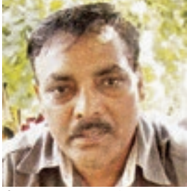
ઈડીસી પ્રમુખ, ખારા બેરાજા

ગામમાં ઈકો ડેવલોપમેન્ટ કમિટિની સ્થાપના કરવામાં આવેલ છે અને તેના દ્વારા ગામમાં ઘરદીઠ શૌચાલયની કામગીરી હાથ ધરાયેલ. હાલ ગામમાં ઘરે ઘરે શૌચાલય છે, જેના દ્વારા ગામમાં સ્વચ્છતા આવી અને ગ્રામજનોના સ્વાસ્થ્ય ખુબ જ સારા રહે છે. આવા કાર્યો દ્વારા પર્યાવરણ પ્રત્યે જાગૃતિ આવી તથા ગામમાં એકતાની ભાવના વધુ મજબુત બની અને મરીન નેશનલ પાર્કના સ્ટાફ સાથે વિશ્વાસનો સેતુ મજબુત બન્યો. આવા કામોથી દરિયાઈ વિસ્તારમાં જતો કચરો પણ બંધ થયેલ જેથી દરિયાઈ જીવસૃષ્ટિને સીધો લાભ થયેલ છે.