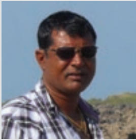
ઈડીસી પ્રમુખ, મોટા આસોટા

ઈકો ડેવલોપમેન્ટ કમિટિ દ્વારા કરવામાં આવેલ સામાજિક અને આર્થિક વિકાસના કામો ખુબ ઉપયોગી સાબિત થયા. દરિયાકાંઠે લગભગ ૪૦૦ વિધા જેટલી ગામની ફળદ્રુપ જમીન રસ્તાના અભાવને કારણે પડતર પડી હતી. પ્રોજેક્ટ અંતર્ગત બનાવવામાં આવેલ રસ્તાને લીધે હાલમાં આ જમીન ખેતીલાયક બની જે સાથે આ રસ્તાના કામ કરી લોકોને રોજગારીમાં અને સમિતિ દ્વારા લોકભાગીદારીથી કરવામાં આવેલ ચેર વાવેતર દ્વારા હાલ ગામલોકોને ગામમાં રોજગારી મળી રહેલ છે. આ ચેરની રક્ષણાત્મક દિવાલથી ગામને સુનામી તથા ખારા પવનોથી રક્ષણ મળશે, આમ ગામમાં થયેલ કાર્ય માટે હું ગામ વતી મરીન નેશનલ પાર્કનો આભાર માનું છું.