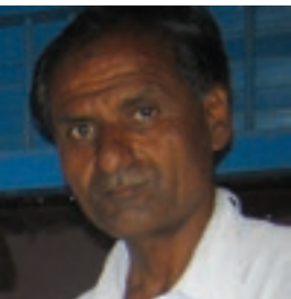
ઈડીસી સરપંચ, મોટા આમલા

એક વાક્ય છે, માણસ પોતે પોતાના કાર્ય વિશે બોલે તેના કરતા તેનું કાર્ય જ બોલી ઉઠે એમાં જ સિધ્ધિના દર્શન થાય છે. આઝાદીના ઈતિહાસ પછી અમારા ગામમાં ગામની અસ્મિતાને ચાર ચાંદ લાગે તેવું કાર્ય મરીન નેશનલ પાર્ક, જામનગર ધ્વારા કરવામાં આવ્યું. મોટા આમલા ગામની સ્થાપના પછી ગામમાં એકપણ શૌચાલય ન હતા. જેના લીધે ગંદકીનું પ્રમાણ વધતું અને તેની અસર લોકોના સ્વાસ્થ્ય પર પડતી હતી. ગામમાં લોકોની નકારાત્મક માનસિકતા તથા નબળી આર્થિક પરિસ્થિતિને લીધે ઘરે શૌચાલય ન હતું જેથી ઘરની સ્ત્રીઓ, વૃધ્ધો તથા બાળકોને ખુબ તકલીફ થતી હતી. અમારા ગામમાં મોટા ભાગના લોકોના ઘરમાં ટી.વી., ટેપ, ફીજ જેવી ભૌતિક સુવિધા હતી પરંતુ આટલી તકલીફ હોવા છતા શૌચાલય બનાવી શક્યા ન હતા. મરીન નેશનલ પાર્ક દ્વારા અમારા ગામની પસંદગી આઈ.સી.ઝેડ.એમ. પ્રોજેક્ટ અંતર્ગત કરવામાં આવી. જેમાં એક સમિતિ બનાવવામાં આવી. ગામમાં સહભાગી ગ્રામીણ ચકાસણી કરવામાં આવી. જેમાં ગામની વિવિધ સમસ્યાઓ વિશે પુછવામાં આવતા