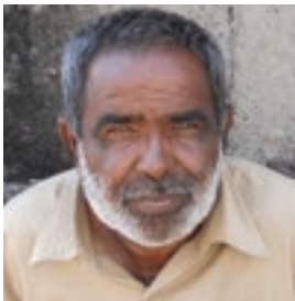
ઈડીસી પ્રમુખ, અજાડ ટાપુ

વિશ્વ બેંક સહાયીત “સંકલિત દરિયાકાંઠા વિસ્તાર વ્યવસ્થાપન કાર્યક્રમ” અંતર્ગત મરીન નેશનલ પાર્ક, જામનગર દ્વારા આજે અજાડ ટાપુ પર લોક ભાગીદારી દ્વારા કરવામાં આવેલ કામગીરીમાં સોલાર લાઈટ નાખવામાં આવેલ. જેના લીધે ટાપુ પર અજવાળા પથરાયા. આ સુમસાન ટાપુ પર આજે પૂર્ણમાનો ચંદ્ર ખીલ્યો છે અને ગ્રામજનો અને વન વિભાગ વચ્ચે વિશ્વાસનો સેતુ ઉભો થયો છે.