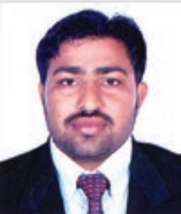
ઈડીસી પ્રમુખ, વિરપુર લુસારી

“સંકલિત દરિયાકાંઠા વિસ્તાર વ્યવસ્થાપન” કાર્યક્રમ અંતર્ગત અમારા ગામમાં ઈકો ડેવલોપમેન્ટ કમિટિની રચના કરવામાં આવેલ. જેમાં ગામમાં સામાજિક અને આર્થિક વિકાસને લગતી પ્રવૃત્તિઓ કરવા માટે ગામમાં સહભાગી ગ્રામીણ ચકાસણીનો કાર્યક્રમ રાખવામાં આવેલ. જે ખ્યાલ અમારા માટે કંઈક નવો જ હતો. જેમાં ગામની મુશ્કેલીઓ ગ્રામજનો દ્વારા જણાવવામાં આવેલ. આ પ્રક્રિયા બાદ ઈકો ડેવલોપમેન્ટ કમિટિ દ્વારા જુદી જુદી મીટીંગો દ્વારા એન્ટ્રી પોઈન્ટની કામગીરી નક્કી કરવામાં આવેલ. જેમાં પાણીની સમસ્યા ખુબ હોય, તે ધ્યાને લઈ ગામના મુખ્ય તળાવમાં રીનોવેશન અને કાઢીયાની કામગીરીને પ્રાધાન્ય આપવામાં આવેલ. જે મરીન નેશનલ પાર્ક દ્વારા મંજૂર કરી કમિટિ દ્વારા તે કામગીરી પુર્ણ કરવામાં આવેલ. આજે ગામ લોકાએ આ કામગીરીને બિરદાવી છે.