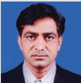
ઈડીસી પ્રમુખ, ખીજડીયા

આજના ઝડપી યુગમાં પર્યાવરણ અને જૈવ વૈવિધ્યતાના સંરક્ષણ માટે ગામનાં લોકો આવા કાર્યક્રમમાં જોડાય અને પર્યાવરણને પ્રતિકૂળ હોય તેવા સાધનોના ઉપયોગ ઓછો કરે તેવા પ્રયત્નો ગામની ઈકો ડેવલોપમેન્ટ કમિટિ દ્વારા હાથ ધરવામાં આવેલ છે. મરીન નેશનલ પાર્ક દ્વારા વિના મુલ્યે આપવામાં આવેલ સુર્ય કુકર અને ગોબર ગેસ ના ઉપયોગ દ્વારા આજે ગ્લોબલ વોર્મિંગની પરિસ્થિતિ તરફ સકારાત્મક પગલુ ભરેલ છે.