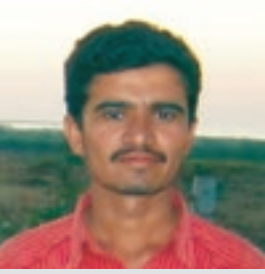
ઈડીસી પ્રમુખ, કાલાવડ સીમાણી

સંસ્થા કોઈપણ હોય, સંસ્થાને પોતે કરેલા કાર્યોનું ગૌરવ હોય જ, પરંતુ વધારે મહત્વની વાત એ છે કે, લોકોને સંસ્થાનું કાર્ય કેવું લાગ્યું? લોકોને જે તે સંસ્થા કેટલી પોતીકી લાગે છે? તે વિશેષ મહત્વની બાબત છે. લોકો તરફથી તેમને મળેલા પ્રતિસાદ એ જ મહત્વની વાત છે આવો જ કંઈક સારો પ્રતિભાવ હું સરકારી સંસ્થા મરીન નેશનલ પાર્ક, જામનગર વિશે આપવા માગુ છુ. અમારા ગામની પસંદગી આઈ. સી.ઝેડ.એમ. પ્રોજેક્ટ અંતર્ગત કર્યા પછી સમિતિ બની. ત્યાં સુધી તો એવું લાગતું ન હતું કે, સરકારી જંગલખાતા દ્વારા ગામને કાંઈક લાભ થાય તેવું કાર્ય થશે. પરંતુ ગામમાં ગ્રામિણ સહભાગી ચકાસણી થઈ ગામની પાણીની સમસ્યાને ધ્યાને લેવાઈ અને મારા ગામમાં આજે મરીન નેશનલ પાર્ક દ્વારા ચાલતા આઈ. સી.ઝેડ.એમ. પ્રોજેક્ટ અંતર્ગત ઈકો ડેવલોપમેન્ટ કમિટિ દ્વારા પાણીના સાત સ્ટેન્ડ પોસ્ટ બનાવવામાં આવ્યા જ્યાંથી બહેનો પાણી ભરી શકે. એક કુવો બનાવવામાં આવ્યો તથા એક નવું તળાવ બન્યું. જેને લીધે ગામમાં પાણીની સમસ્યાનું નિવારણ થયું. જ્યારે ગામના પશુઓમાં રોગચાળો આવ્યો ત્યારે વિના મુલ્યે પશુનિદાન અને સારવાર શિબિરનું આયોજન, સોલાર કુકરનું વિતરણ, ફળાઉ કલમી રોપાનું વિતરણ વગેરે જેવા પર્યાવરણ લક્ષી કાર્યો કરી મરીન નેશનલ પાર્ક ગામમાં પોતાની અલગ છાપ ઉભી કરી છે અને ગામ વતી હું આજે મરીન નેશનલ પાર્કના અધિકારીશ્રીઓ તથા સ્ટાફનો આભાર માનું છું.